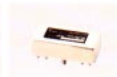
FL-52A CW-SCHMALFILTER Mittelfreq.: 455 kHz Bandbreite: 500 Hz/-6 dB