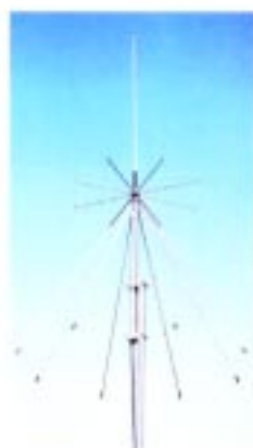
AH-7000 BREITBAND-DISC-ANTENNE Frequenzbereich: 25-1300 MHz