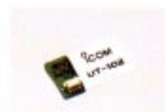
UT-102 SPRACHSYNTHESIZER Akustische Frequenzsäge.