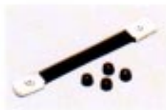
MB-23 TRAGEGRIF Mit vier Füßen.