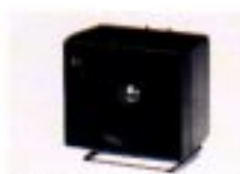
SP-7 EXT. LAUTSPRECHER Eingangsimpedanz: 8 Ω Max. Eingangsleistung: 5 W