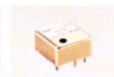
CR-293 QUARZOFEN (TCXO) Frequenzstabilität: ± 0,5 ppm bei 0°C bis +60°C