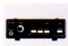
TV-R7100 TV/FM MODUL Für den Empfang von TV-Sender und FM-Stereosender.