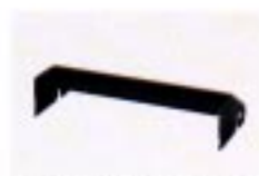
MB-12 MOBILHALTERUNG Für Mobilbetrieb; mit Einstellwinkel.