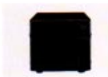
SP-21 EXT. LAUTSPRECHER Eingangsimpedanz: 8 Ω Max. Eingangsleistung: 5 W