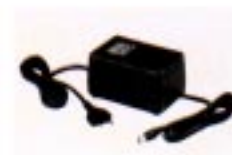
AD-55 NETZADAPTER Für den Betrieb des Empfängers mit AC-Strom.